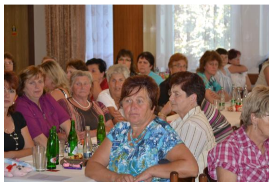
Účastnice krajské konference